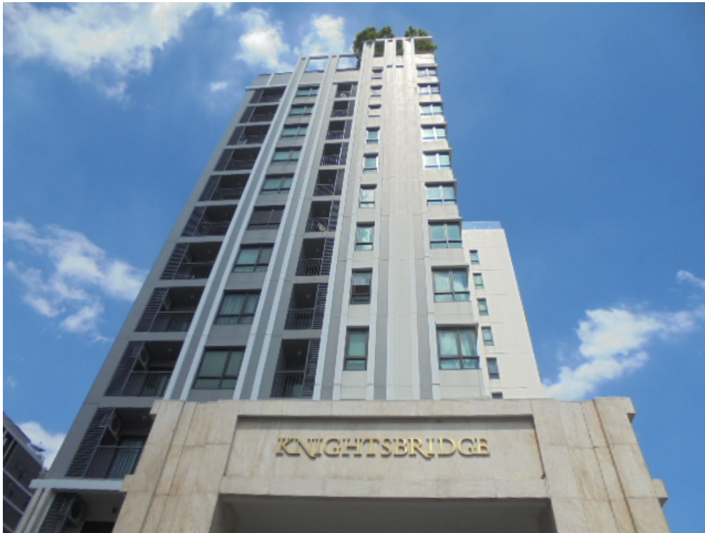
รูปที่ 1-2 สภาพภายนอกของโครงการ